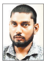
ब्लैकमेलिंग करने वाला आरोपी गिरफ्तार