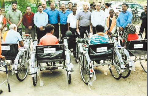
उपकरण देते हुए अडानी फाउंडेशन के अधिकारी।

अदानी फाउंडेशन ने अपने कॉर्पोरेट सामाजिक उत्तरदायित्व (सीएसआर) कार्यक्रम के तहत करतला ब्लॉक के ग्राम पताड़ी स्थित सामुदायिक स्वास्थ्य केंद्र (सीएचसी) में बुनियादी सुविधाओं को सुदृढ़ बनाने की दिशा में महत्वपूर्ण कदम उठाया है। सोमवार को आयोजित कार्यक्रम में स्वास्थ्य केंद्र को आवश्यक उपकरण और सामग्री सौंपी गई। साथ ही आसपास के दिव्यांगजनों को सहायक उपकरण वितरित किए गए। अदानी फाउंडेशन की पहल के तहत सीएचसी पताड़ी को एयर कंडीशनर, डीप फ्रीजर, टेलेविजन, रोगी बेड, लॉकर, वॉटर चेंबर और कूलर जैसी सामग्री प्रदान की गई। वहीं दिव्यांगजनों के लिए