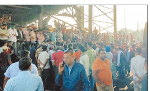
घटना के दौरान लगी श्रमिकों की भीड़।