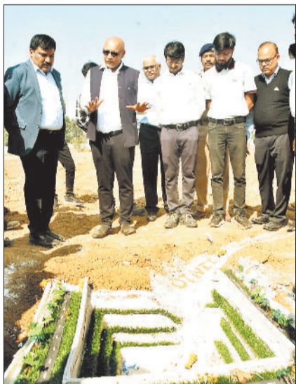
भूमिपूजन के दौरान उपस्थित एसईसीएल के अधिकारी।