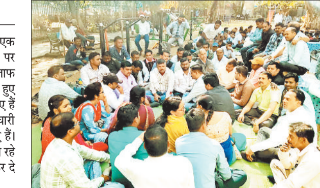
संभागीय मुख्यालय के धरने में बैठे समिति के कर्मचारी।

बीते एक सप्ताह से संभागीय मुख्यालय के धरने में जिले के समिति कर्मचारी चरणबद्ध तरीके से शामिल होकर अपनी उपस्थिति दर्ज करा रहे हैं इससे समितियों में