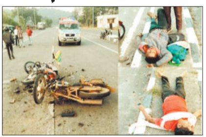
घटनास्थल में गिरी बाइक व मृतक।