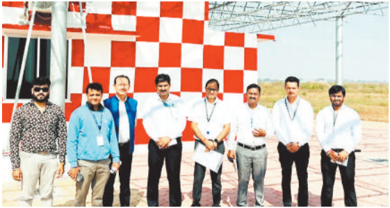
डीवीओआर मशीन की जांच के लिए आए अधिकारी।

एयरपोर्ट अथॉरिटी ऑफ इंडिया की दो सदस्यीय टीम नाइट लैंडिंग के लिए डीवीओआर मशीन की जांच कर रही है। पिछले दो दिनों से प्री कमीशनिंग सर्वे का काम किया जा रहा है। टीम 12 नवंबर को लौट जाएगी। बताया जा रहा है कि सर्वे रिपोर्ट एएआई के हेडक्वार्टर भेजा जाएगा। जिसके बाद डीजीसीए की टीम सर्वे कर नाइट लैंडिंग की स्वीकृति दे सकेगी।