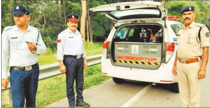
कार्यवाही करते हुए यातायात पुलिस।