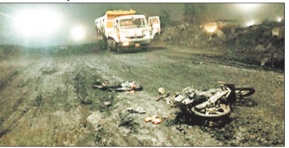
घटनास्थल जहाँ हुआ हादसा।