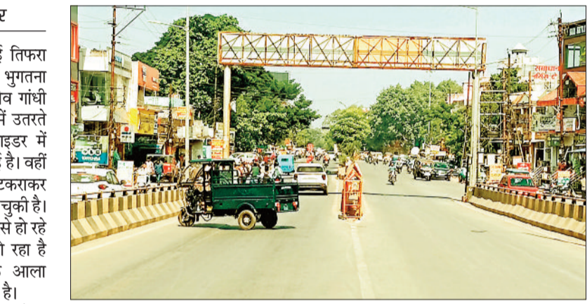
महाराणा प्रताप चौक के पास फ्लाईओवर से रायपुर-बिलासपुर नेशनल हाईवे सीधे जुड़ा हुआ है। रायपुर की ओर से आने वाले वाहन चालक तेज रफ्तार से आते हैं। फ्लाईओवर से दो सौ मीटर आगे मोड़ है। उसी जगह पर चालक अनियंत्रित होते हैं और विपरीत दिशा से आ रही तेज रफ्तार गाड़ी से भिड़ जाते हैं। फ्लाईओवर की शुरुआत में कोई संकेतक भी नहीं लगाया गया है। इसके चलते दोनों ओर से आने वाले चालक स्पीड से वाहन चलाते हुए गुजरते हैं। इसके परिणाम स्वरूप सड़क दुर्घटना होती है। फ्लाईओवर में प्रत्येक एक माह में औसतन पांच दुर्घटनाएं होती हैं। इससे कई लोग घायल भी हो चुके हैं। फ्लाईओवर में सड़क दुर्घटना होती है तो ऐसी स्थिति में अनियंत्रित होकर गाड़ी के फ्लाईओवर से नीचे गिरने का खतरा रहता है। कम स्पीड में वाहन

गलत ड्राइंग डिजाइन से बनाई गई तिफरा ओवरब्रिज का खामियाजा लोगों को भुगतना पड़ रहा है। महज दो साल में राजीव गांधी चौक फ्लाई ओवरब्रिज के दलान में उतरते समय 13 चार पहिया वाहन डिवाइडर में चढ़कर पलटकर दुर्घटना ग्रस्त हो गई है। वहीं फ्लाई ओवरब्रिज के उपर रैलिंग से टकराकर कार सवार एक युवक की मौत भी हो चुकी है। प्रत्येक माह औसतन पांच सड़क हादसे हो रहे हैं। लोगों की जान से खिलवाड़ हो रहा है लेकिन प्रशासन और पुलिस के आला अधिकारियों का इस तरफ ध्यान नहीं है।