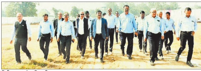
निरीक्षण करते अधिकारी।

कोल इंडिया का पहला प्रोजेक्ट टेक्नोलॉजी एक आधुनिक खनन तकनीक है, जिसके माध्यम से खदानों से निकले फ्लाई ऐश, टेलिंग्स या अपशिष्ट पदार्थों को पानी और