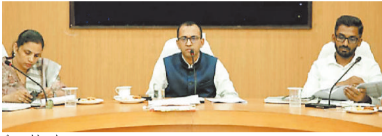
बैठक लेते कलेक्टर।

समीक्षा करते हुए अधिकारियों को लॉबिंग प्रकरणों के शीघ्र निराकरण के निर्देश दिए। उन्होंने 13 नवम्बर को सरदार वल्लभभाई पटेल की 150वीं जयंती के अवसर पर आयोजित होने वाली रन फॉर यूनिटी के संबंध में आवश्यक दिशा-निर्देश दिए। कलेक्टर ने कार्यक्रम की रूपरेखा तैयार करने, रूट चार्ट को अंतिम रूप देने तथा आम नागरिकों एवं सभी शासकीय